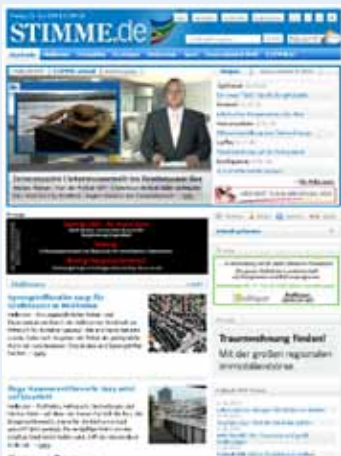
STIMMEaktuell wird in das Nachrichtenangebot von Stimme.de integriert.