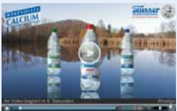
Auch die vorgeschalteten Werbespots werden im Haus produziert.