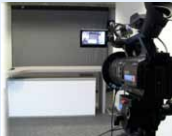
Tägliche Produktion im hauseigenen Studio.