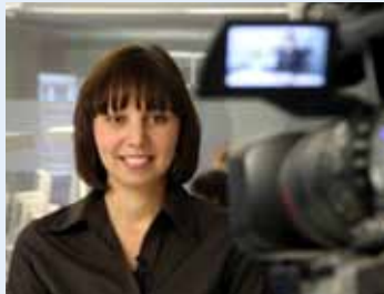
Die Moderatoren sind Printredakteure der Heilbronner Stimme.