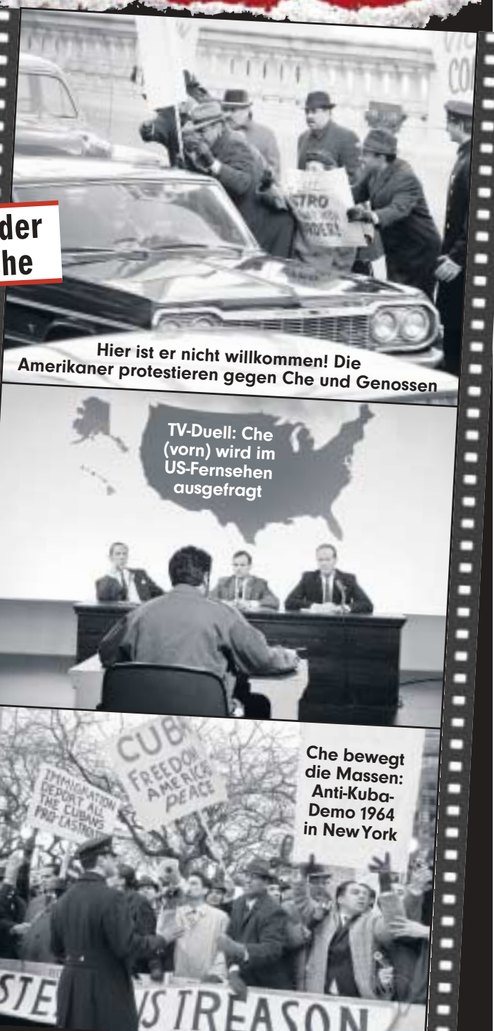
Hier ist er nicht willkommen! Die Amerikaner protestieren gegen Che und Genossen