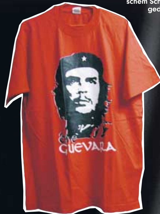
T-Shirt-Ikone: Ernesto Guevara de la Serna, genannt Che Guevara (1928–1967)

Oscar-Star Benicio Del Toro (42, „Traffic“) als Kubas Revolutionsheld – in zwei Teilen!