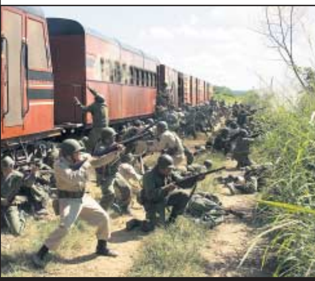
Endstation Tod: Die Regierungstruppen werden aufgegeben

Ein Film für Ikonen-Fans – und Joschka Fischer (61!) (132 Min./FSK: ab 12 Jahren)