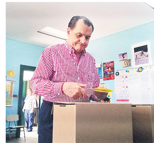
PRIMERA HORA / EDGAR VÁZQUEZ COLÓN