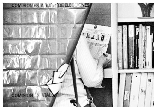
LOS LÍDERES del Partido Republicano en la Isla estuvieron muy satisfechos con la cantidad de electores que votaron en las primarias.