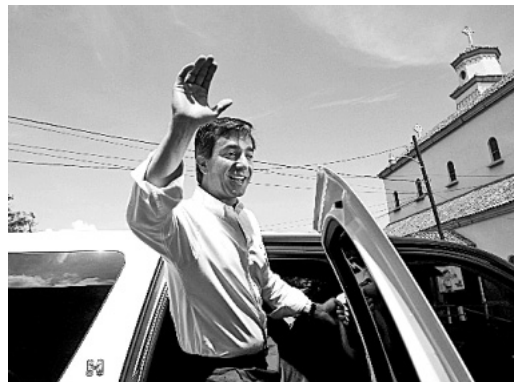
EL GOBERNADOR Luis Fortuño votó ayer en la Academia San José.

idioma oficial de cara a una estadidad pudieron haber afectado adversamente los resultados.