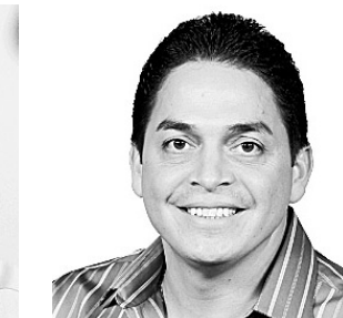
DAVID BONILLA El representante PNP por el distrito 18 iba anoche camino a la derrota