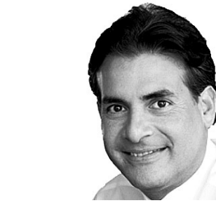
EDUARDO BHATIA Encabeza la lista de los senadores por acumulación del Partido Popular