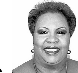
PERZA RODRÍGUEZ La alcaldesa PNP de Cabo Rojo irá a la reelección tras vencer a José Morales